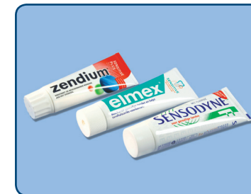
Gebruik een niet-schurende tandpasta