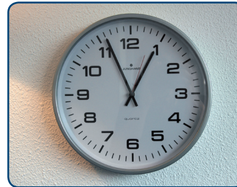
Eet of drink één uur voor het tandenpoetsen geen zure producten

Het oppervlak van tanden en kiezen wordt zachter door de inwerking van zuur. Als u direct na het eten of drinken van zuur uw tanden poetst, kunt u de glazuurlaag gemakkelijk wegpoetsen. Dan slijt uw gebit dus nog sneller.