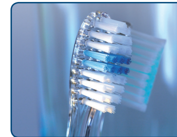
Gebruik een zachte tandenborstel

Poets tweemaal per dag uw tanden en kiezen zorgvuldig met een zachte tandenborstel. Gebruik een niet-schurende tandpasta, bijvoorbeeld Zendium, Elmex of Sensodyne. U oefent voldoende druk uit als u de borstel aan het eind van het handvat vasthoudt tussen uw duim en de toppen van uw vingers. Poets alle plekken in de mond even zorgvuldig. Als u tandenstokers of ragers gebruikt, beperk dit dan tot één keer per dag. Eet of drink één uur voordat u uw tanden poetst geen zure producten.